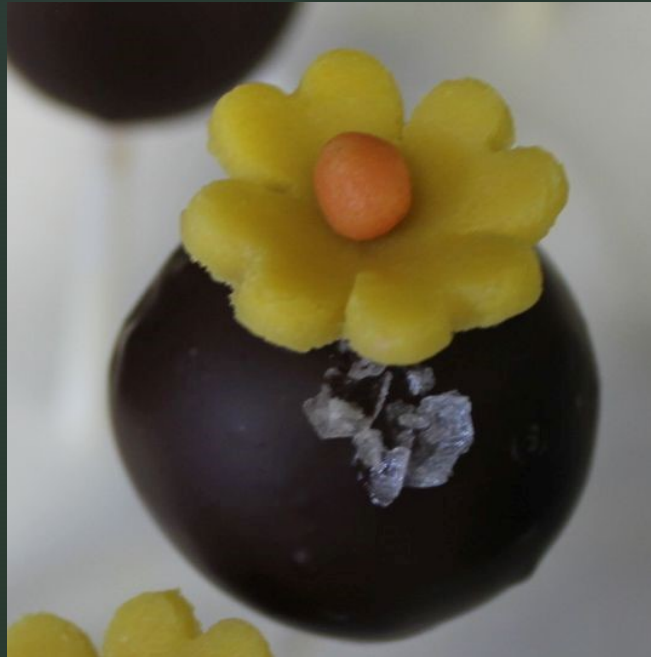
Schokoladen-Schaustück mit Meersalz-Lollies