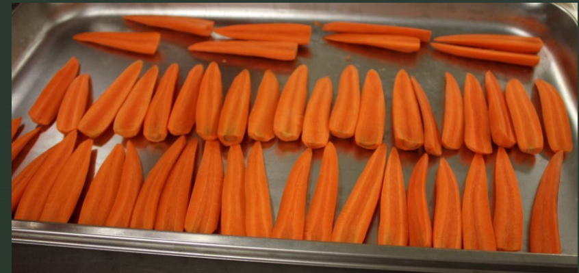
Vorbereitung –gefüllte Karotten