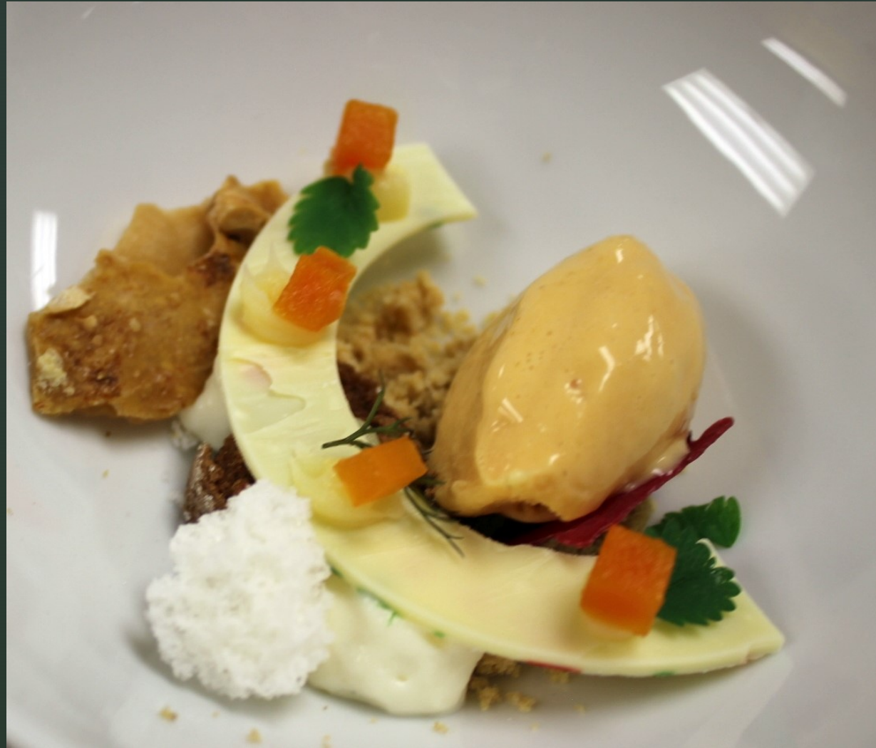
Hokkaido, Hafereis, Haferstreusel, Schokoladenkuchen, Grand-Manier-Creme, Felszucker, Ziegenkäse-Espuma, Gebackener Karamel