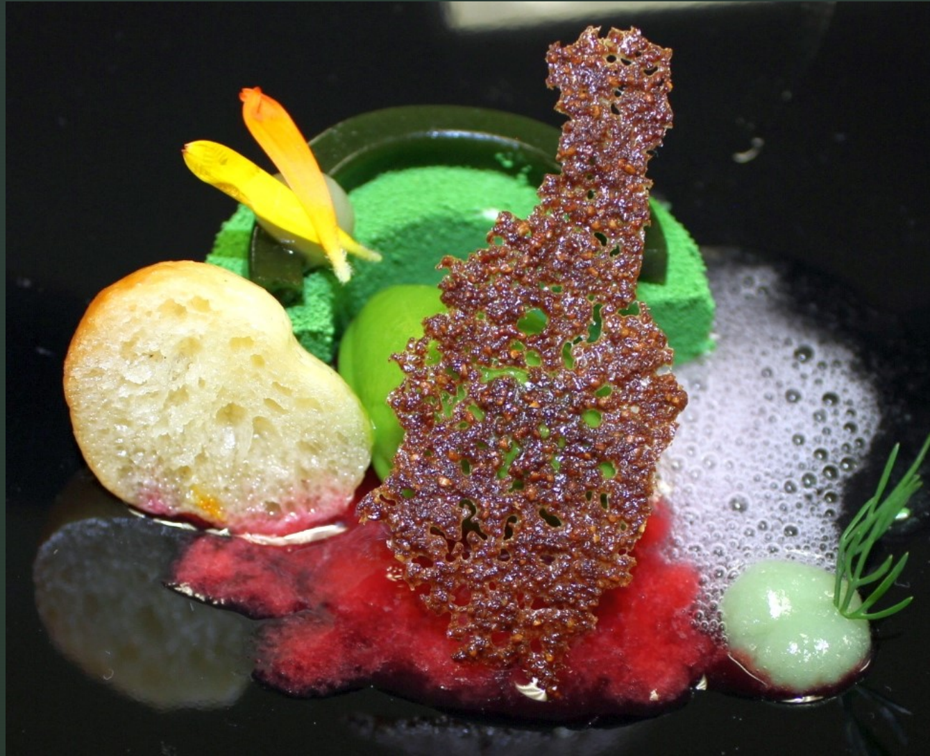
Butterpilz, Wiesenkräutermousse, Kräutergelee, Holundersüppchen, Löwenzahn-Sorbet