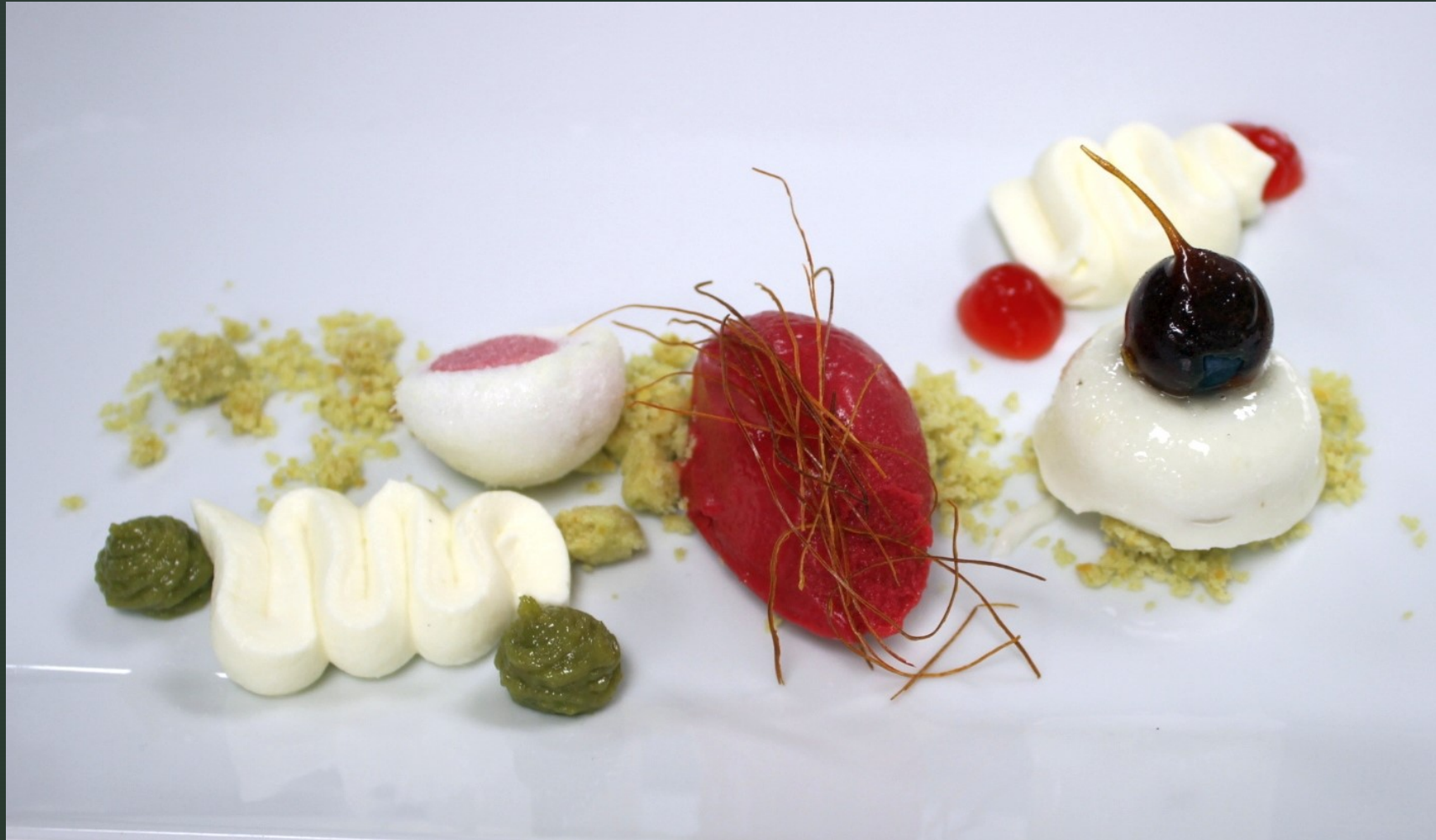
Himbeer-Gel, Pistaziencreme, Himbeer- und Joghurt-Marshmellows, Himbeer-Spice-Sorbet, Joghurt-Rote-Bete-Mousse