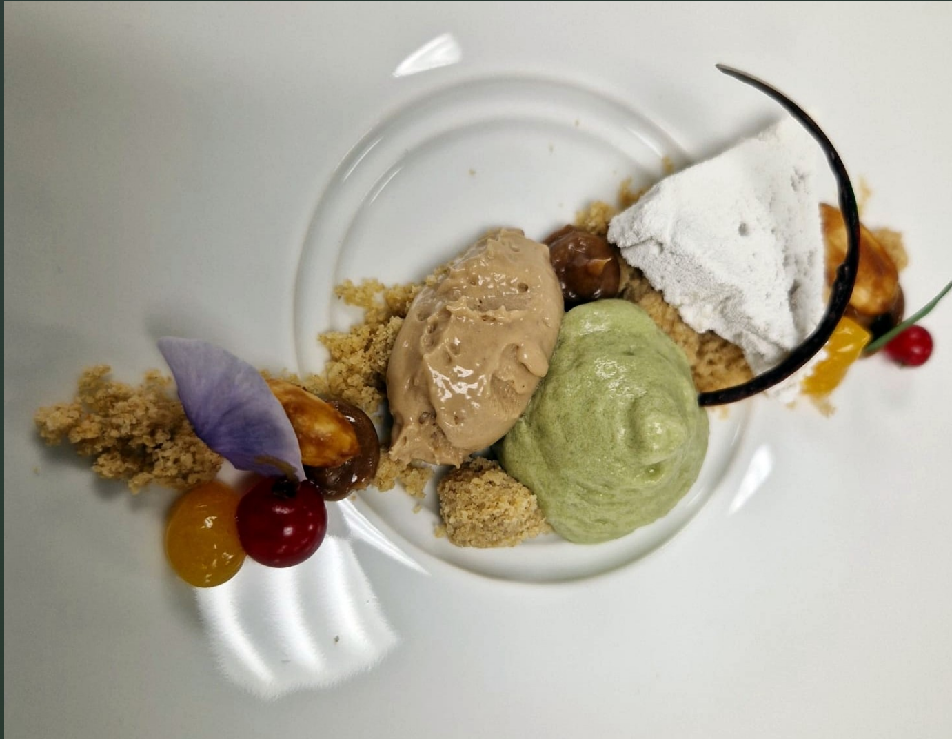
Boden, Grand-Manier-Eissouffle, Nougat-Creme, Passionsfrucht-Gel, Grüne-Tomate-Matcha Espuma, Karamel Eis